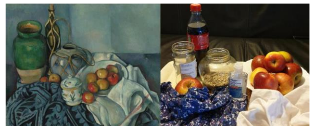
Still life with apples , 1893-9, Paul Cezanne

* Ricorda: non è obbligatorio condividere i risultati sui social, possiamo anche mostrare la nostra opera a pochi eletti!