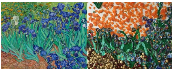
IRIS , 1889, Vincent Van Gogh

ricreare quadri famosi in casa, con gli oggetti della quotidianità!