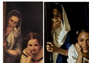
Galiziane alla finestra , 1655-1660, Bartolome Esteban Murillo