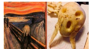
L' urlo , 1893, Edvard Munch

La challenge vuole stimolare la nostra vena artistica mentre ripassiamo un po' di arte (☺)!